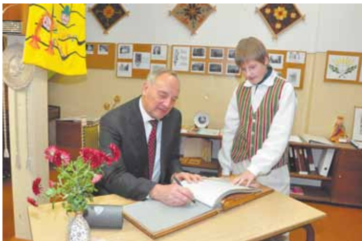
Valsts Prezidents par piemiņu parakstās Medumu vidusskolas goda viesu grāmatā

Prezidents tika iepazīstināts ar skolas darbību un tās panākumiem, aplūkojot bibliotēku un muzeju. A.Bērziņš skolai uzdāvināja 12 jaunus grāmatas un ierakstīja novēlējumu divās goda viesu grāmatās, kuras lapās jau lepojās Vairas Viķes - Freibergas ieraksts no 1999.gada. Skolas aktu zālē vidusskolas kolektīvs sarūpēja svētku priekšnesumu – skolēni muzicēja, dejoja, dziedāja un rādīja Medumu vidusskolas Marionēšu teātra uzveduma fragmentu.