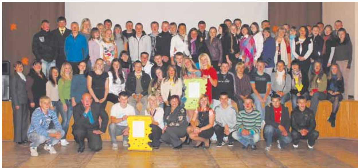
Projekts apvienoja vairāk kā 185 Daugavpils novada jauniešus

Noslēguma pasākums tika organizēts tā, lai jaunieši uzzinātu kaut ko papildus jaunatnes politikas virzienā. Pasākuma pirmajā daļā notika Jauniešu Saeimas interaktīvā spēle, kurā bija gan partijas – jauniešiem bija jāizdomā partijas nosaukums, sauklis un atšķirības zīme-mandāts balsojumam - gan likumprojekti, balsojumi utt.