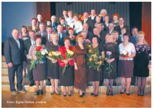
Lauksaimnieku godināšana kļuvusi par ikgadēju tradīciju