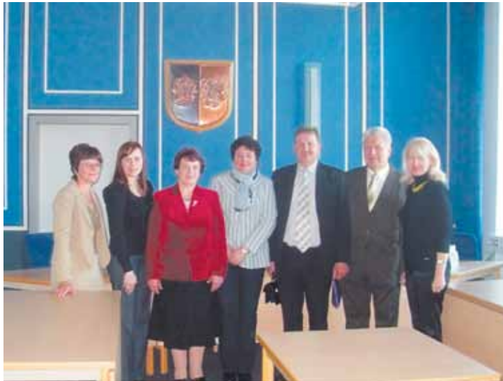
Projekta dalībnieki Gustrovas tiesas nama sēžu zālē

Latvijas grupa devās arī uz stacionārās palīdzības centriem, lai klātienē novērotu, kā darbojas dažādi atbalsta centri bērniem un ģimenēm. Pirmais tika apmeklēts Bērnu dienas centrs, kur tiek sniegts atbalsts bērniem un vecākiem. Bērni uz centru nāk pēc skolas, lai nodarbotos ar interešu izglītību un apgūtu socializēšanās prasmes – tiek mācītas vienkāršas lietas, kas noder turpmā-