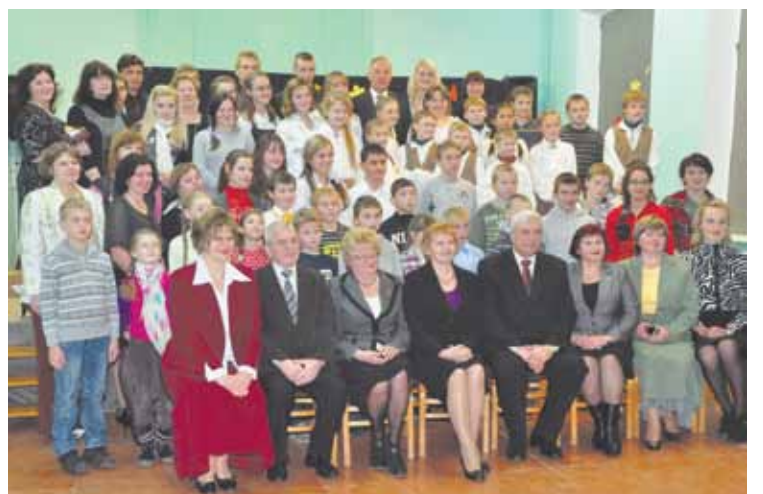
Prezidenta vizīte tiek iemūžināta kopbildē ar skolas kolektīvu

Prezidents pateicās skolēniem un skolotājiem par iespēju apmeklēt vienu no lauku mazajām skolām. „Es pats esmu nācis no mazas lauku skolas. Mana skola bija vēl mazāka. Cilvēka lielumu