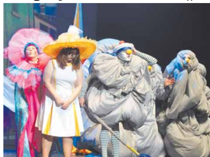
Muzikālā kustību izrāde uzbur stāstu par mīlestības un brīnuma gaidām