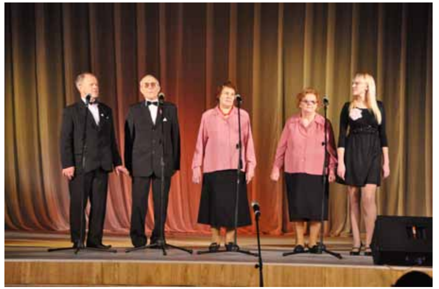
Naujenes pagasta senioru vokālais ansamblis „Cerība” priecēja ar skaistām dziesmām