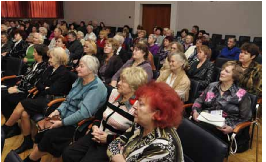
Projekta noslēguma pasākums pulcēja pilnu zāli ar senioriem

biedrības. V.Kezika: „Mēs katru gadu biedrībām piešķiram finansējumu projektiem, kuri tiek sagatavoti un iesniegti dažādos fondos. Esiet aktīvi un rakstiet projektus. Ja mēs sadarbosimies, strādāsim, nebaidīsimies iziet ārā no mājām, satiksimies ar draugiem, tad mums nekad nedraudēs tā saucamā senioru depresija.”