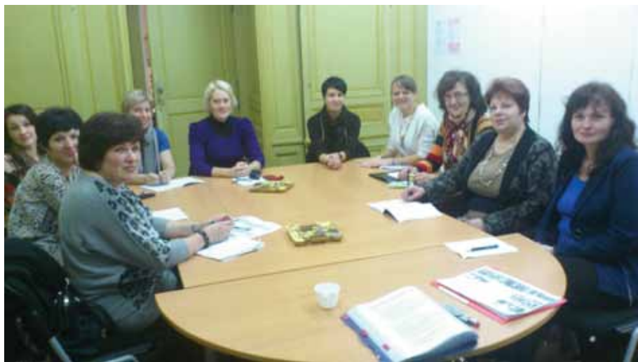
Bordo pilsētas apmeklējuma noslēguma dienas tika pavadītas interaktīvajās darbnīcās

Mūzizglītības programmas Leonardo Da Vinci apakšprogrammas projekta „Inovāto ideju un labās prakses pārņemšana karjeras izaugsmes nodrošināšanai” ietvaros no 29.oktobra līdz 4.novembrim Daugavpils novada speciālistu delegācija viesojās Francijā, pilsētā Bordo. Daugavpils novada delegāciju pārstāvēja Izglītības pārvaldes speciālisti, Daugavpils novada karjeras konsultanti un novada izglītības iestāžu direktori.