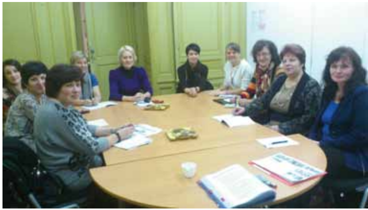
Визит в Бордо завершился занятиями в интерактивных мастерских

Делегация специалистов Даугавпилсского края с 29 октября по 4 ноября в рамках проекта непрерывного образования «Передача инновационных идей для обеспечения карьерного роста» программы Леонардо да Винчи посетила во Франции, в городе Бордо. В состав делегации Даугавпилсского края вошли специалисты управления образования, карьерные консультанты Даугавпилсского края и директора учебных заведений края.