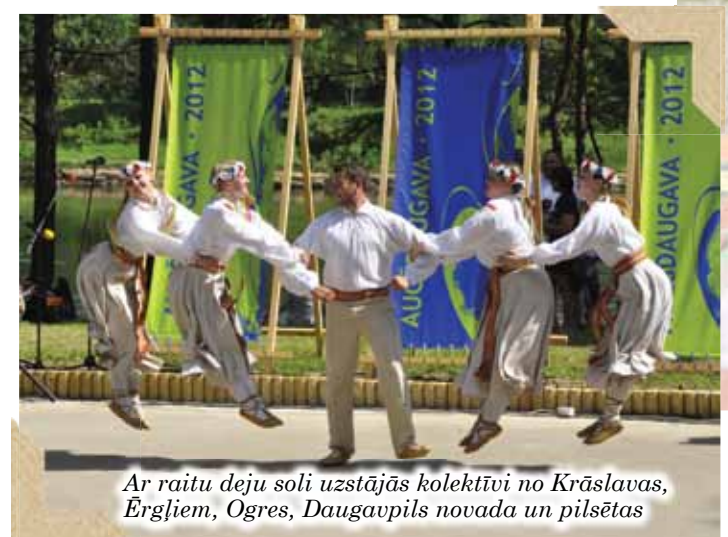
Ar raitu deju soli uzstājās kolektīvi no Krāslavas, Ērgļiem, Ogres, Daugavpils novada un pilsētas