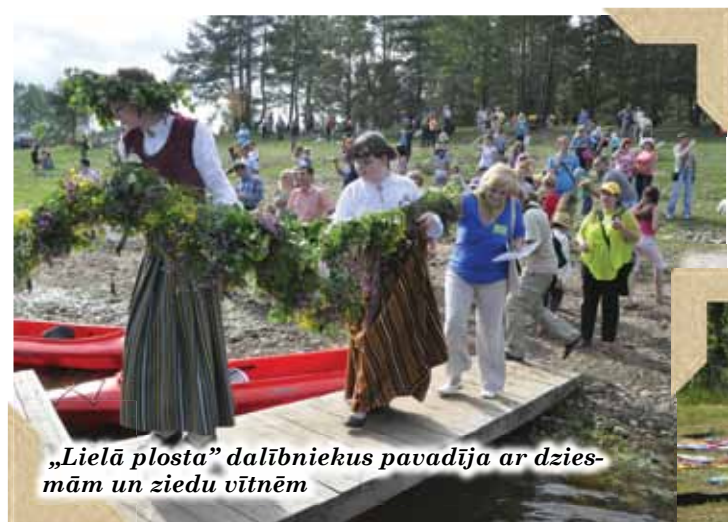
„Lielā plostā” dalībniekus pavadīja ar dziesmām un ziedu vitnēm