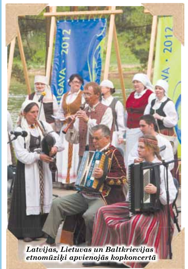
Latvijas, Lietuvas un Baltkrievijas etnomūziķi apvienojās kopkoncertā

Fotomirkļi no festivāla „Augšdaugava 2012” norisēm >>>3.lpp