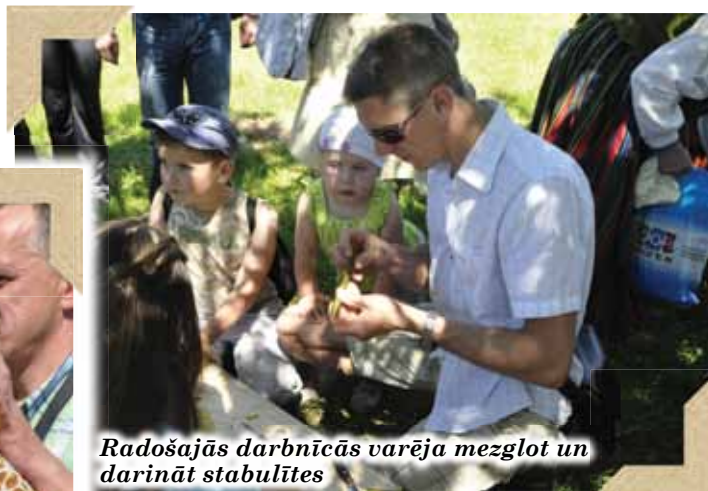
Radošajās darbnīcās varēja mezglot un darināt stabulītes