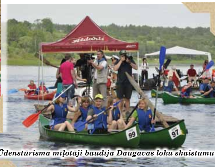
Ūdenstūrisma mīļotāji baudīja Daugavas loku skaistumu