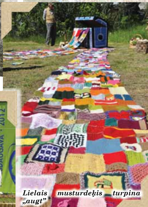
Lielais musturdeķis turpina „augt”