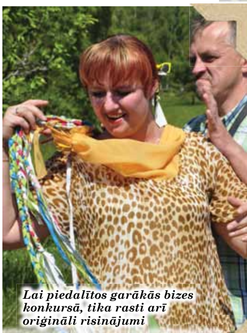
Lai piedalītos garākās bizes konkursā, tika rasti arī oriģināli risinājumi