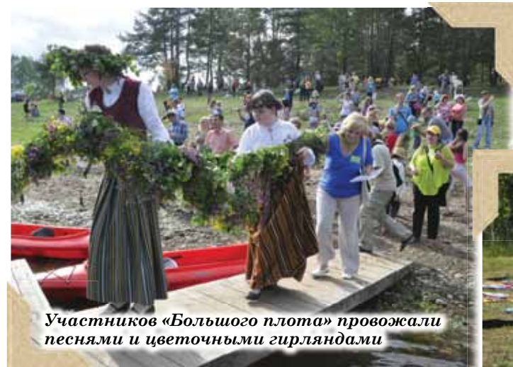
Участников «Большого плота» провожали песнями и цветочными гирляндами