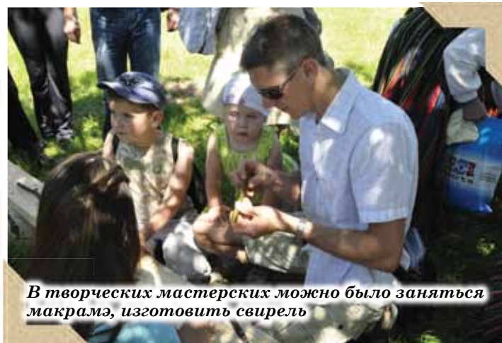
В творческих мастерских можно было заняться макраме, изготовить свирель