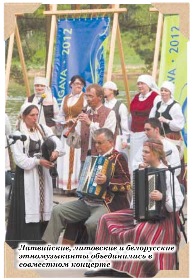
Латвийские, литовские и белорусские этномузыканты объединились в совместном концерте

Фотомоменты фестиваля „Augšdaugava 2012” на 3 стр. ▶▶▶