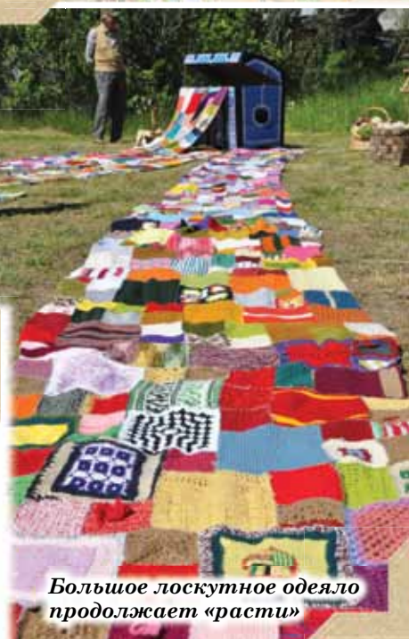
Большое лоскутное одеяло продолжает «расти»