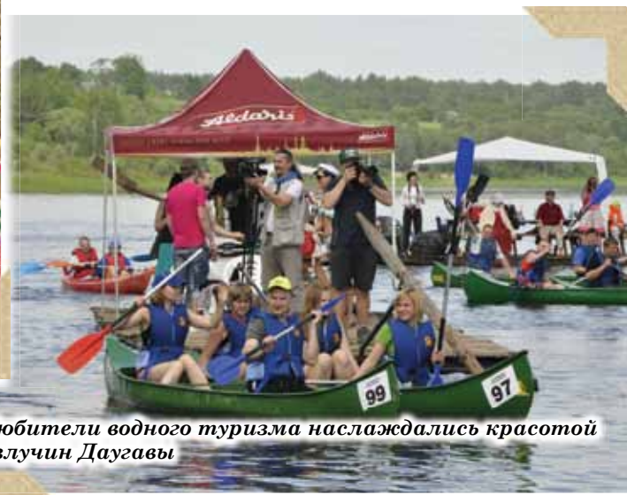
Любители водного туризма наслаждались красотой излучин Даугавы