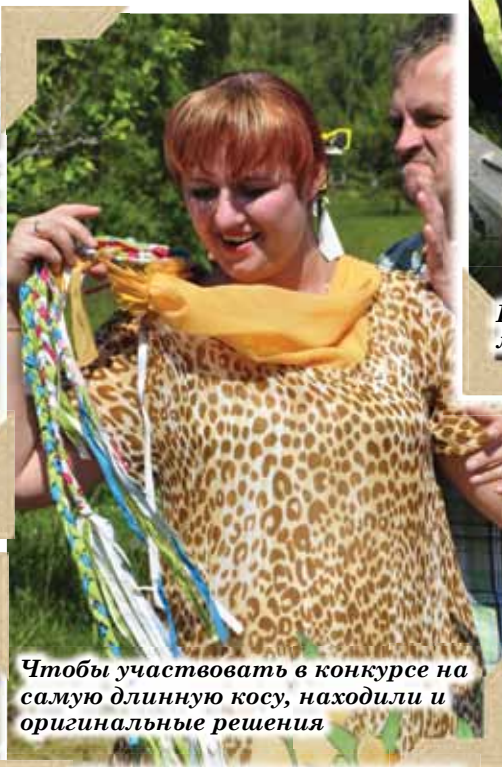
Чтобы участвовать в конкурсе на самую длинную косу, находили и оригинальные решения