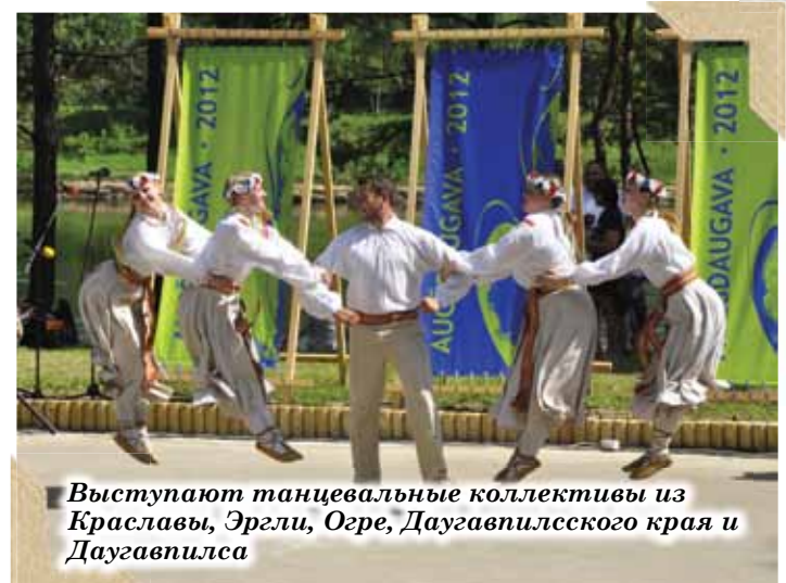
Выступают танцевальные коллективы из Краславы, Эргли, Огре, Даугавпилсского края и Даугавпилса