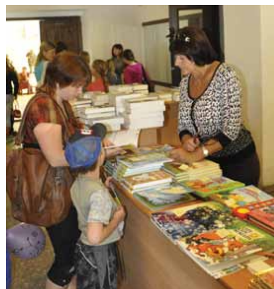
Книжные издательства посетителям праздника предлагали большой ассортимент книг

В продолжение мероприятия состоялся концерт популярного актера Яниса Паукштелло. Зрители с удовольствием подпевали знакомые мелодии, дарили цветы и просили автограф. Тем временем остальные спешили