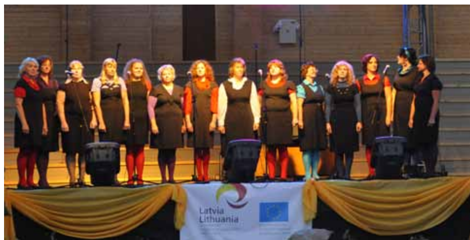
Вокальный ансамбль Зарасайского центра культуры «Чичерис»