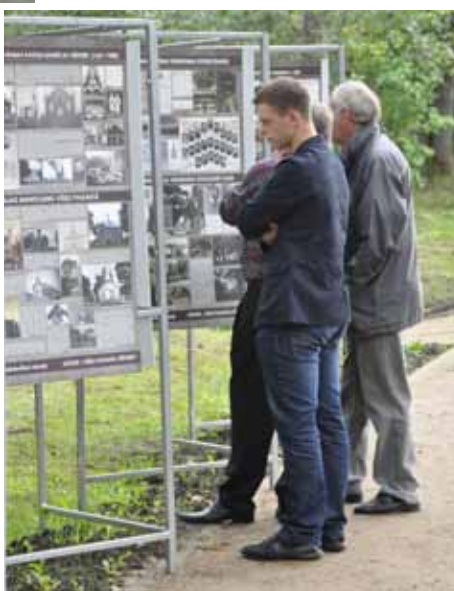
На фотовыставке можно было ознакомиться с историей Вишкской волости