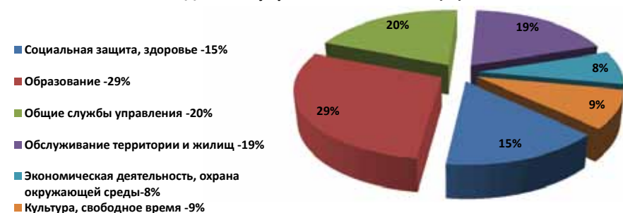
Рис. 4. Структура расходов в бюджете самоуправления Даугавпилсского края в 2013 г., %

На сферу образования запланированы средства в размере 4,7 млн. латов, что составляет 29% от общих расходов самоуправления в 2013 году. В крае на 1 января было 2274 учащихся в общеобразовательных и дошкольных учебных заведениях. В среднем самоуправление на содержание одного ученика в учебном заведении на год планировало средства в размере 687,26 латов, а в целом на 2013 год – 1,6 млн. латов. В свою очередь на перевозку школьников на волостном транспорте запланировано 378 тысяч латов.