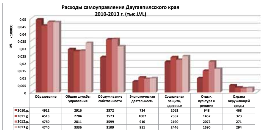
Рис. 3. Динамика расходов, 2010-2012 гг. фактич., 2013 г. план и целевая дотация на зарплату учителей на 8 месяца, тыс. латов

Увеличение расходов самоуправления Даугавпилсского края в разрезе функций связано с объемом реализации проектов, поддерживаемых структурными фондами ЕС. В 2013 году в крае на момент составления бюджета запланированы расходы на реализацию проектов во всех отраслях в объеме 2,5 млн. латов, что составляет 15% всех расходов.